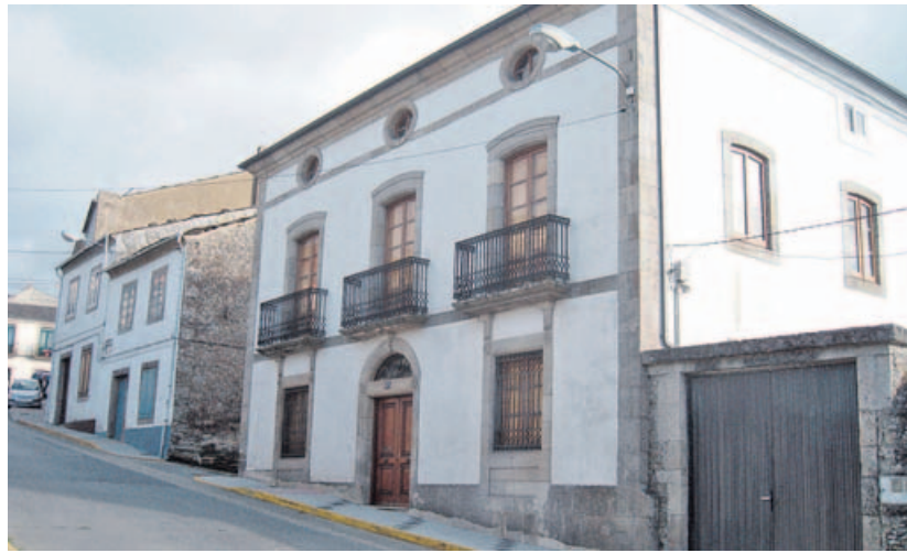
No primeiro edificio pola dereita, na rúa Betanzos, funcionou a Academia Santa María. PALACIOS